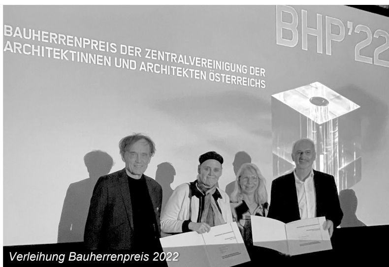
Verleihung Bauherrenpreis 2022

Der Bauherrenpreis wird an Auftraggeber verliehen, welche sich der Baukultur in einem über das übliche Ausmaß hinausgehend verschrieben haben. Im Speziellen für die Modernisierung unter bedachtem Umgang der bestehenden Substanz.