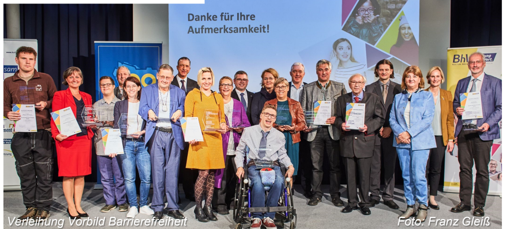
Verleihung Vorbild Barrierefreiheit