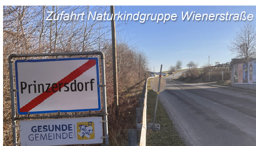
Zufahrt Naturkindgruppe Wienerstraße