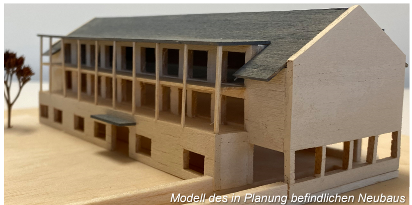
Modell des in Planung befindlichen Neubaus

Die Notwendigkeit basiert auf gestiegenen Baupreisen, Zinslage sowie das hohe Angebot an Wohnungen in der Region. Der Bauboom der letzten Jahre in St. Pölten ist das beste Beispiel dafür.