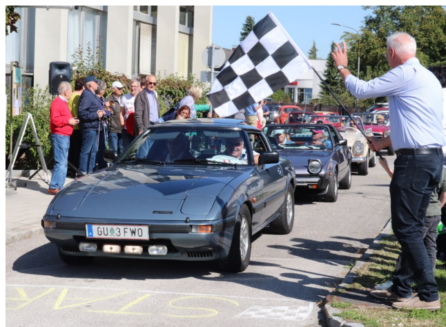
Aus nah und fern besuchten die Teilnehmer der Oldtimerrallye am Nachmittag unsere Gemeinde.