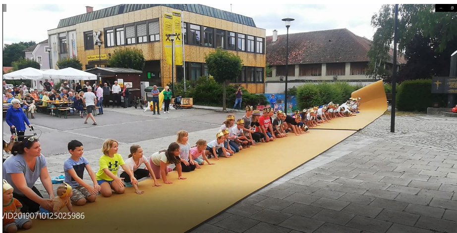
Die Prinzenrolle – als Tagesgaudi!

Am 10. Juli 2019 machte die ORF-Sommertour Station am Hauptplatz in Prinzersdorf. Gesendet wurde „Live“ in Radio NÖ mit zahlreichen Interviews von 13:00 Uhr bis 16:00 Uhr. 3 Stunden stand unsere Marktgemeinde im Mittelpunkt einer Radiosendung. Für einen Beitrag in ORF2 in der Sendung „NÖ HEUTE“ um 19:00 Uhr war ein Kamerateam mit Redakteur Robert Morawec den ganzen Tag für ein Ortsporträt unterwegs. Naherholung – Fliegenfischen an der Pielach, Ferienspaß mit der Bewegungswoche und das Jubiläum 50 Jahre Marktgemeinde waren u.a. die Themen.