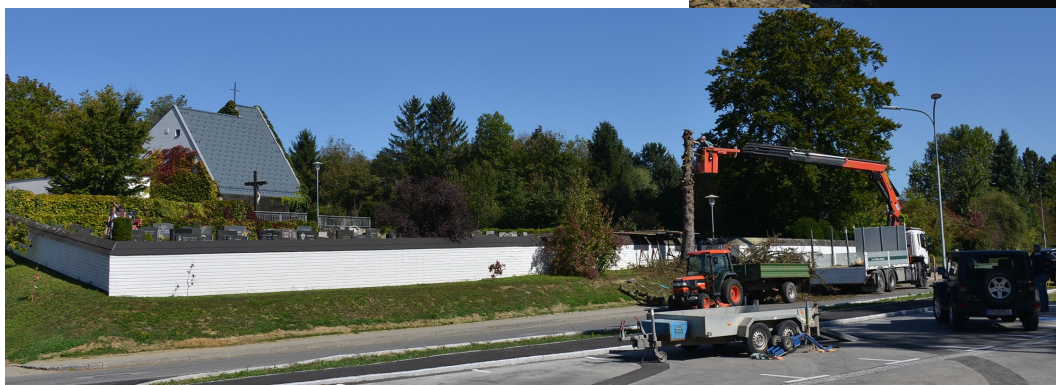
Foto: Mit Unterstützung der Firma Holzbau Schütz wurden jene Bäume, welche leider von einem Käferbefall betroffen waren, erfolgreich entfernt und durch zwei neue Säuleneichen ersetzt.