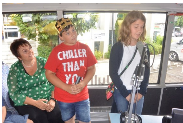
Radiointerview 2 — NMS Nützlingshotel