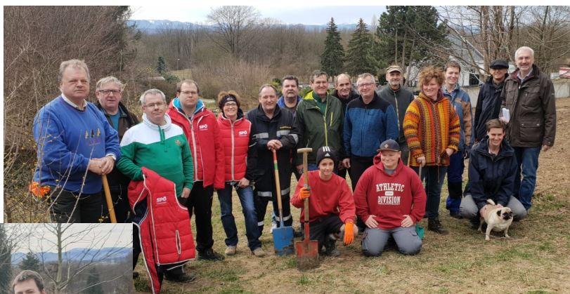
Gruppenfoto der freiwilligen Helfer—Vielen Dank!

Im Jahr 2019 wurden auch die Arbeiten rund um die Friedhofserweiterung abgeschlossen. Einen beträchtlichen Teil verdanken wir hier unseren zahlreichen freiwilligen Helfern, die hier vollen Einsatz gezeigt haben.