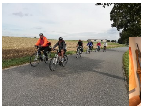
Dem Wind entgegen