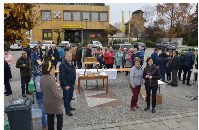
Alle singen "FaPri-FaPri-FaPri" ...