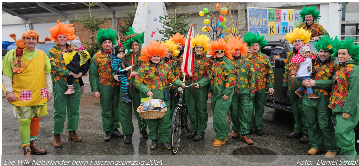
Die WIR Naturkinder beim Faschingsumzug 2024