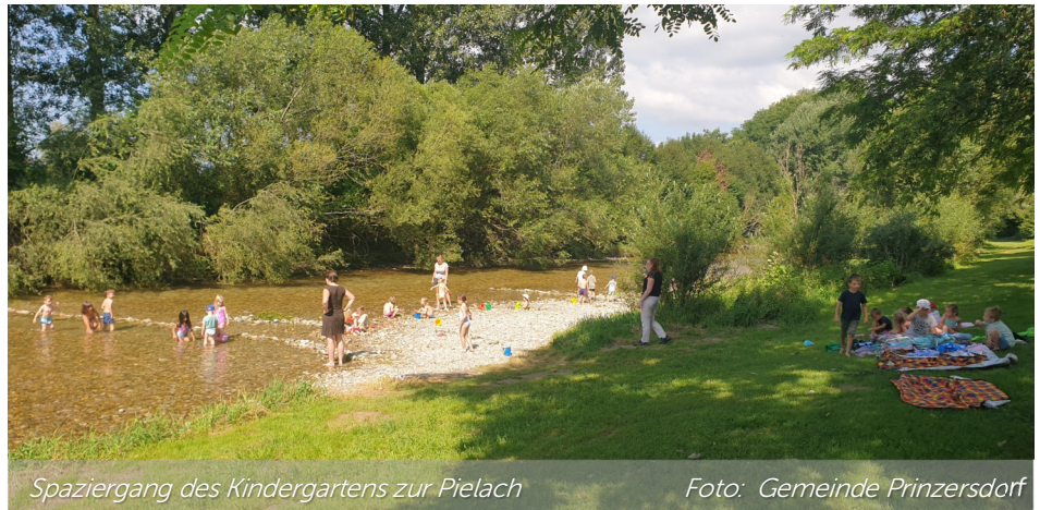
Spaziergang des Kindergartens zur Pielach

Im Zuge eines Architekturwettbewerbes konnte aus sieben eingereichten Projekten, geführt durch ein Preisgericht, einstimmig ein Siegerprojekt auserwählt werden. Angedacht sind in Summe 6 Gruppen inkl. Tagesbetreuung.