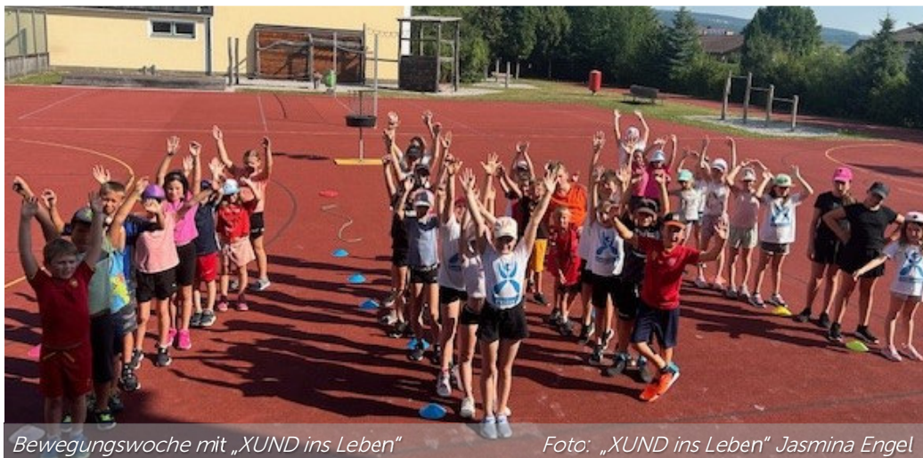
Bewegungswoche mit „XUND ins Leben“

Auch in Zukunft werden WIR uns dafür einsetzen, den Ferienspaß am Puls der Zeit zu halten und ein attraktives Ferienprogramm in Prinzersdorf auf die Beine zu stellen, welches all die Möglichkeiten und Highlights unseres Ortes nutzt.