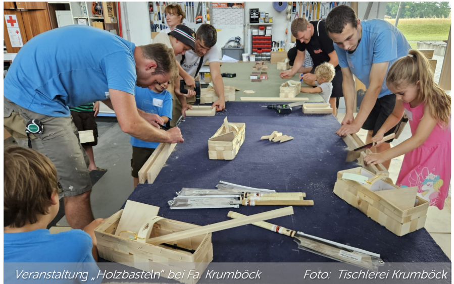
Veranstaltung „Holzbasteln“ bei Fa. Krumböck

Dieses Jahr feiert der Ferienspaß in Prinzersdorf sein 20-jähriges Jubiläum . Der perfekte Moment, um einen Blick in die Vergangenheit zu werfen und die bisherige Erfolgsgeschichte dieser einzigartigen Initiative zu würdigen .