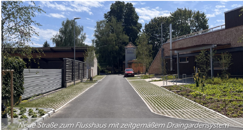
Neue Straße zum Flusshaus mit zeitgemäßem Draingardensystem

Ihr Bau- und Infrastrukturausschuss, GGR Franz Schütz.