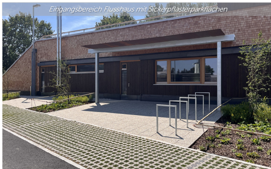
Eingangsbereich Flusshaus mit Sickerpflasterparkflächen