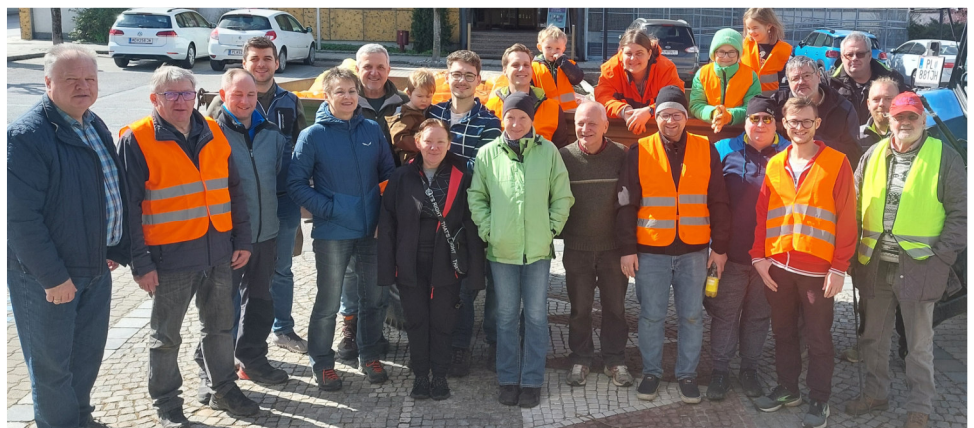
Die fleißigen Müllsammler nach der Mittagspause im Rathaus